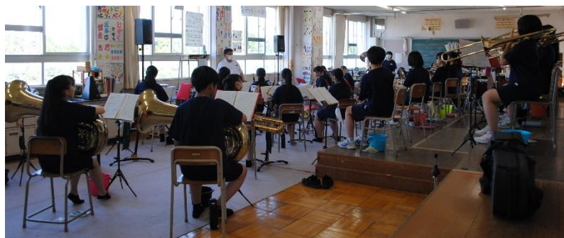
↑練習に励む吹奏楽部

7月29日(金)、市民会館にて北海道吹奏楽コンクール函館地区大会が行われます。全道大会につながる大会に向けて、吹奏楽部は日々熱心な練習を続けています。良い結果を期待しています。